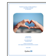
Évaluation de la deuxième distribution