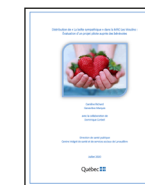
Évaluation de la première distribution